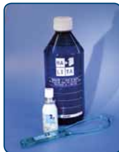
Gorgelmiddel, mondspray en tongreiniger

Reinig uw tong met een tongreiniger. Schraap in ongeveer vijf keer de bacteriën en het slijm van uw tong af. Hoe verder u achter op uw tong komt, hoe meer u kunt weghalen. Reinig uw tong twee keer per dag, het liefst 's ochtends en 's avonds. Onderzoek toont aan dat het reinigen van de tong met een tongreiniger effectiever is dan met een tandenborstel. Levert het tongreinigen onvoldoende resultaat op? Dan is een intensievere verzorging nodig. Soms moet u naast het tongreinigen de bacteriën die uw slechte adem veroorzaken, doden met gorgelmiddelen en/of een mondspray (Halita). Tongreinigers en sprays zijn zonder recept bij uw apotheek verkrijgbaar. Overleg met uw tandarts of mondhygiënist hoe vaak u de tongreiniger of de andere middelen kunt gebruiken.